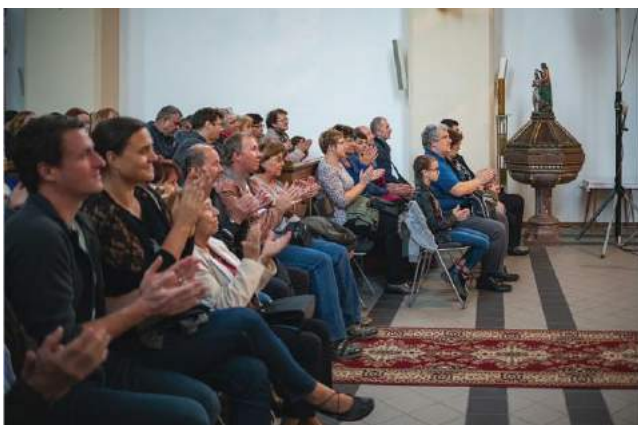
Benefiční koncert Spirituál Kvintet