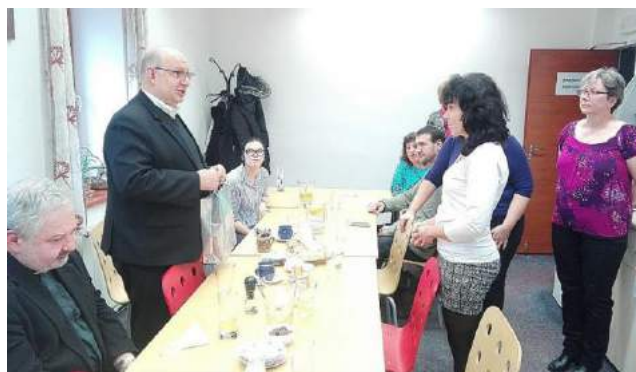
Návštěva ředitele Arcidiecézní charity Praha